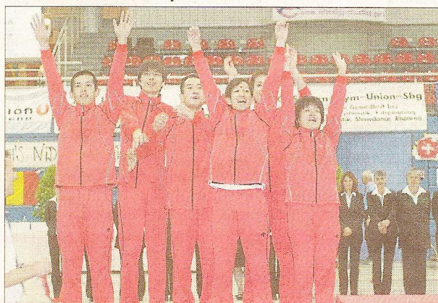
Das japanische Team wird am Sonntag beim World Team Cup sein Können zeigen.